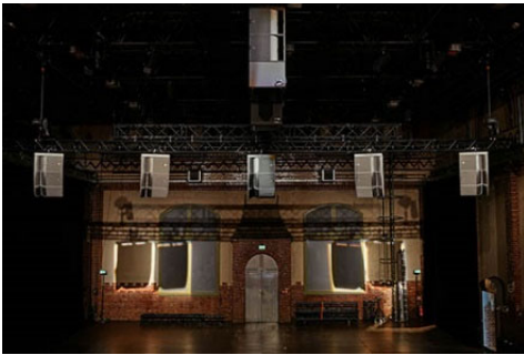
Halle, Radialsystem

Ein Ort für unkonventionelle Hörerfahrungen: Im Radialsystem treffen klassische und zeitgenössische Kompositionen aus unterschiedlichen Musiktraditionen auf zeitgenössischen Tanz, elektroakustische Klänge verweben sich mit Instrumentalmusik, und Klanginstallationen erschaffen außergewöhnliche akustische Räume. Als erster Veranstaltungsort in Deutschland installiert das Radialsystem – ein Ort für den Dialog der Künste und Ankerinstitution der Freien Szene in Berlin – das L-ISA Immersive Hyperreal Sound-System, das derzeit international als Maßstab für die Beschallung von Live-Veranstaltungen gilt. Ermöglicht wurde dies aus Mitteln der Stiftung Deutsche Klassenlotterie Berlin sowie der Senatsverwaltung für Kultur und Europa.