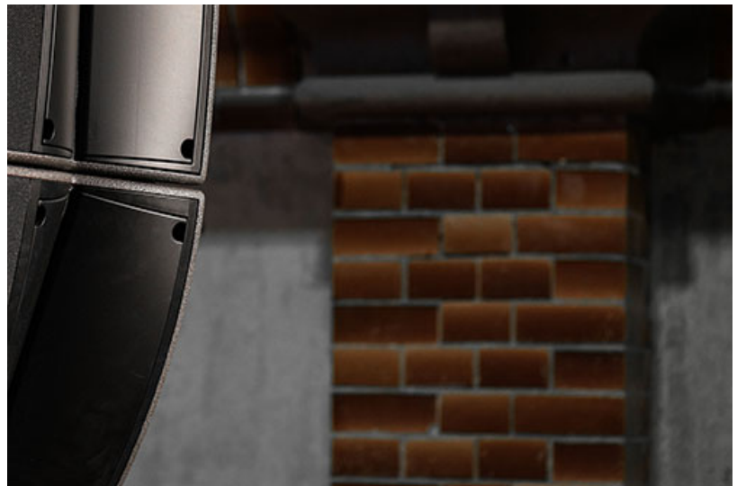
A15-Arrays im Radialsystem

Hyperrealistische, immersive Hörerlebnisse: Die L-ISA Immersive Hyperreal Sound Technologie liefert klare und natürliche Audiosignale, die bei Hörer*innen das Gefühl entstehen lassen, sich inmitten einer Klangkuppel zu befinden. Lautsprecher-Hängungen im gesamten Raum – über der Bühne, an den Seiten und im gesamten Veranstaltungsbereich – hüllen das Publikum in den Klang ein. Anders als bei konventioneller Stereo-Beschallung kann so nahezu das gesamte Publikum den originalen und perfekten Sound wahrnehmen, der sonst nur an wenigen Plätzen zu hören ist. Durch die objektbasierte Klangmischung können die Klänge zudem konkret auf ihre Quelle lokalisiert und fast beliebig im Raum zugeordnet werden: Man hört etwas von dort, wo man es auch sieht. Die Technologie ermöglicht es außerdem, Klanggebilde aus anderen Räumen identisch „nachzubauen“ und zu übertragen.