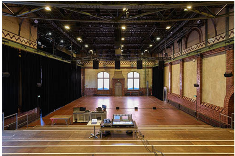
L-ISA in der Halle, Radialsystem